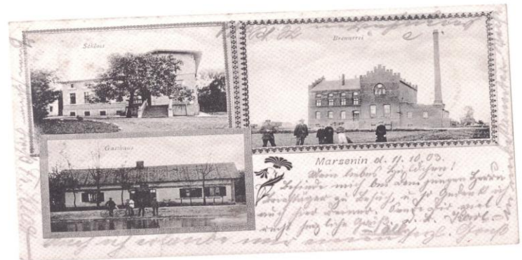
Brak wydawcy, 1903