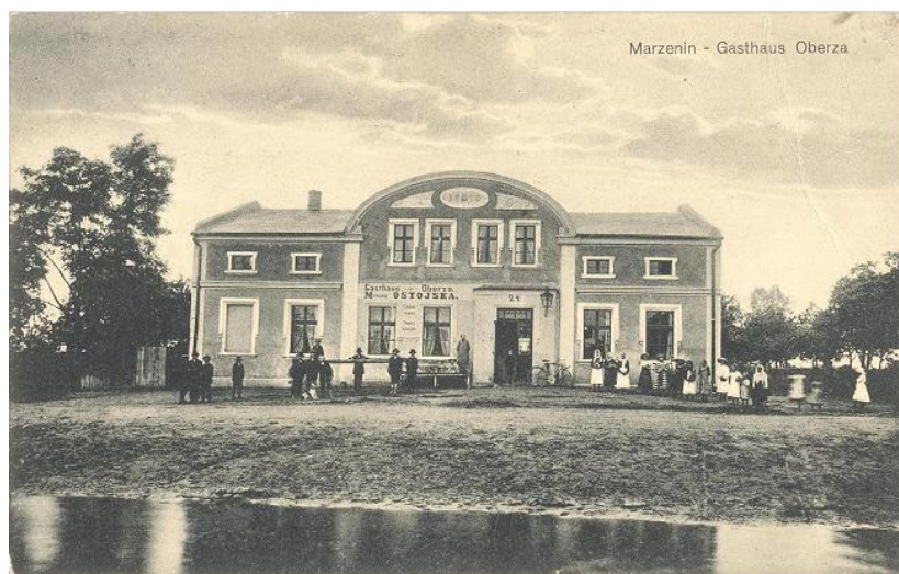
U góry z lewej zabudowania Ostrowskiego

Fotografia pochodzi z roku 1910. Można by było uznać, że na miejscu gdzie teraz stoi sklep spożywczo-przemysłowy, kiedyś stała kawiarnia, bądź bar.