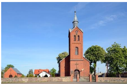
Kościół Świętego Mikołaja w Marzeninie

jest jednak kielich mszalny z drugiej połowy XVI wieku, wykonany przez poznańskich złotników, a ufundowany przez ks. Stanisława z Marzenina przed rokiem 1581.